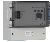
VORT DELTA T Codice 13039