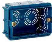
SCI503 Codice 22461